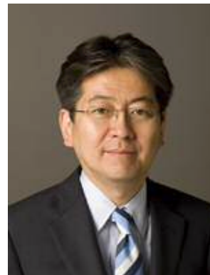
マネックスグループ株式会社 代表取締役会長兼社長 CEO