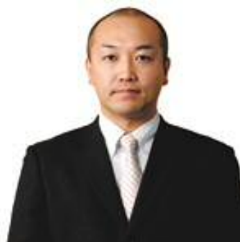
事業創造大学院大学 事業創造研究科

担当科目：経営組織 A、経営組織 B、演習 I・II 新潟大学～北陸先端科学技術大学院大学知識科学研究科博士後期課程単位取得退学。新潟市生まれ。大学卒業後、松下電器産業株式会社(現パナソニック株式会社)にて人事部門に勤務し任用や国際人事を担当。退職後、大学院にてナレッジ・マネジメント(知識経営論)や組織論の研究を開始。あわせて株式会社リクルート・ワークス研究所客員研究員を務めるなど民間企業との共同研究を積極的に行なってきた。組織学会、日本ベンチャー学会、企業家研究フォーラム、Academy of Management 会員。修士(知識科学)。