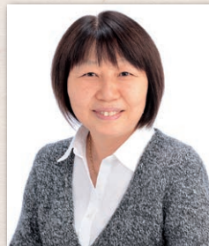
小長谷 有紀 こながや ゆき

京都大学文学部史学科卒。京都大学大学院文学研究科修士課程修了。京都大学大学院博士課程満期退学。京都大学文学部助手を経て、1987年5月より国立民族学博物館第一研究所助手、1993年4月に同研究所助教授、2003年4月に同民族社会研究部教授、2014年4月より現職。専門分野は文化人類学、モンゴル・中央アジアの遊牧文化。主な著書に『モンゴルの春—人類学スケッチ・ブック』、『モンゴルの二十世紀—社会主義を生きた人びとの証言』、『世界の食文化(3)モンゴル』、『人類学者は草原に育つ 変貌するモンゴルとともに』(フィールドワーク選書9)など。日本の文化人類学者として多方面で活躍し、2013年に紫綬褒章受章。