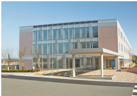
【第 8 研究・実習棟の外観】

した(平成 26 年 3 月)。70 名収容の小講義室 2 室、160 名収容の中講義室 2 室、ゼミ室 2 室、視能訓練士養成に必要な専用実習室及び研究室等を設置しました。