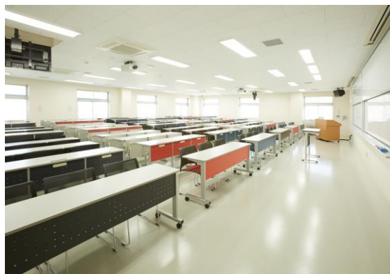
【第 8 研究・実習棟「中講義室」】