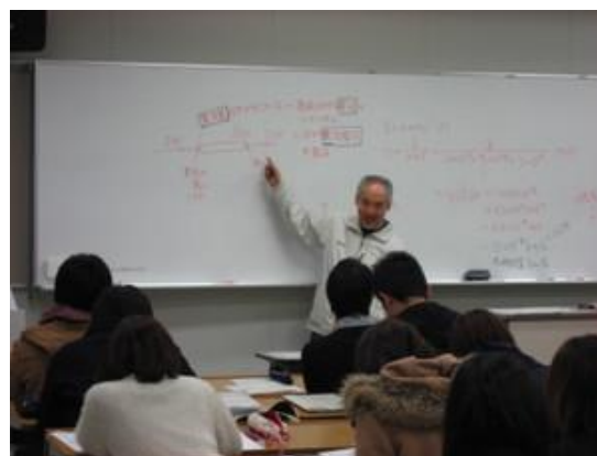
【電気工学基礎セミナーの1コマ】

学習支援センターのコンセプトを「わかる・まなぶ・交わる・相談する」とし学習支援にとどまらず学生生活全般に亘って支援する学生サポートを強化しています。具体的には基礎学力補強セミナー、定期試験等で再試験率が高い科目や不合格者が多い科目についての補強セミナー、ワークショップ（学生同士の交流の場の提供等）及び専門家による学修相談等を開催し学生サポートの強化を推進しています。