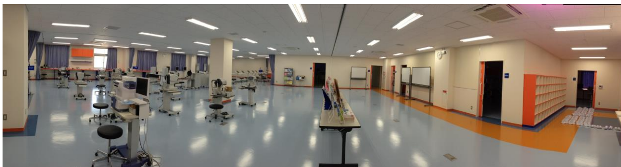
【第 8 研究・実習棟「視機能科学実習室」】