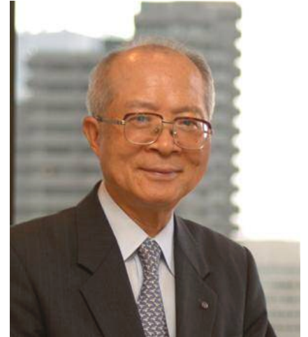
フィデリティ・ジャパン・ホールディングス株式会社 取締役副会長