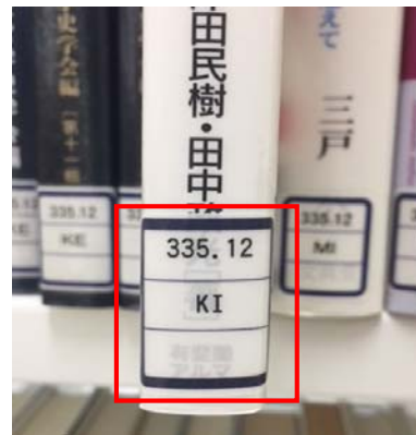
(写真2) 請求記号 (背ラベル)

この情報を見て、この本がどこにあるかを確認します。 この本の場合には、 配架場所は「C1」という棚 (写真1) 請求記号 (背ラベル) は「335.12-KI」 (写真2) 資料番号は本に貼られたバーコードNo.です。